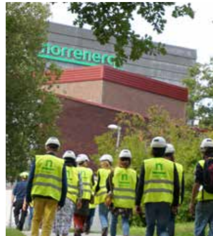
I slutet av augusti kom medarbetare från Sundbybergs stads kulturförvaltning till Solnaverket på studiebesök.

Under året firade vi 25 år som aktiebolag med Solna och Sundbybergs stad som ägare. För att spegla det företag Norrenergi är idag och vår inriktning framåt bytte vi samtidigt logotyp och visuell identitet. Läs mer på sidan 11 och 24.